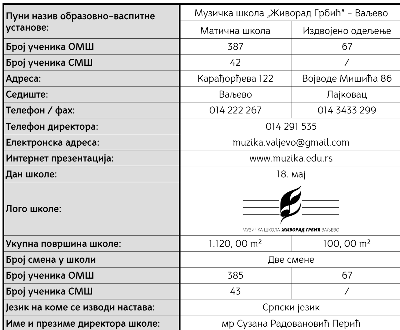
Табела 1.1–1: Основни подаци о школи